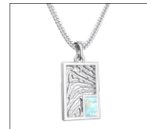
RJP 002 AC

Royolz hangers met & zonder as compartiment