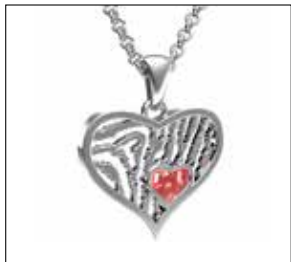
RJP 001 AC