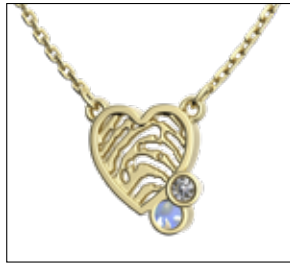
RJM 901 AC