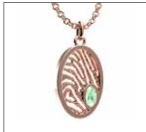
RJP 005 AC