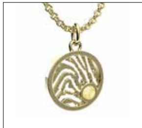
RJP 004 AC