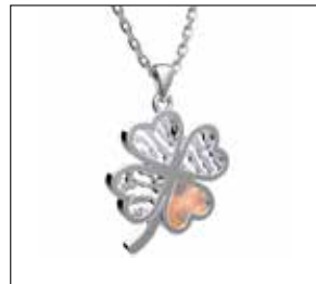
RJP 010 AC