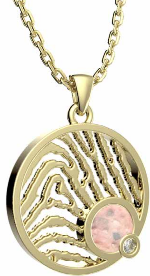
RJP 007 AC